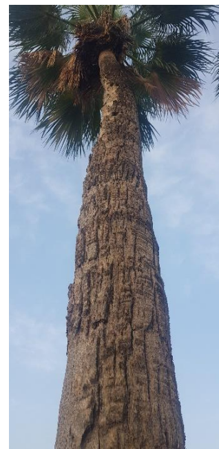
עץ אמצעי גזע עליון וצמרת: