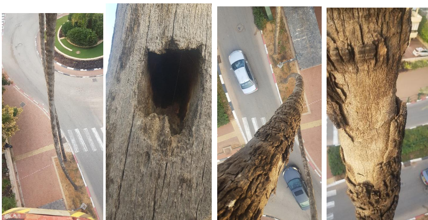
עץ צפוני גזע עליון וצמרת: